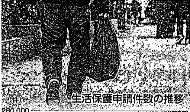
生活保護申請件数の推移