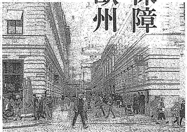
ベーシックインカムの社会実験を予定するフィンランドの首都ヘルシンキ市街地。6月