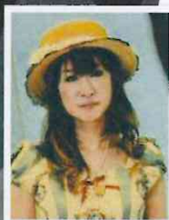
作家 雨宮 処凛